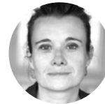
Christine Pelissier Avocat Cabinet FIDAL